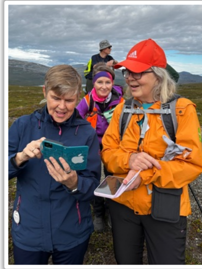
Missäs ny ollaan?